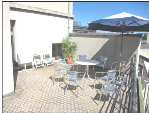
Küchenterrasse, hauseigene Tomaten

Dazu Balkone und mehrere Terrassen mit grandioser Aussicht über die Stadt für Firmenanlässe mit einer Fläche von über 400 m 2 .